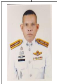
พ.ต.ท.มังกร สอนอัน รอง ผกก.ป.๑